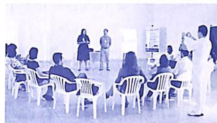
Futuro Auditório onde foi realizada a I Qualificação Geral dos Voluntários OIC - Maio/09

Além da nova estrutura física, apropriada para os trabalhos da Consciencioterapia, já é possível perceber as repercussões multidimensionais deste novo ambiente nos trabalhos da OIC. O padrão de energias, muito intenso e assistencial, reflete o matêmpense da Consciencioterapia. Aguardamos em breve sua visita!