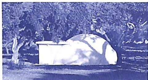
Campus IAC – Evoramonte / Portugal

Preparam as malas, pois em outubro de 2010 a Organização Internacional de Consciencioterapia (OIC) e a International Academy of Consciousness (IAC) aguardam em Portugal todos os pesquisadores interessados na Conscienciologia, na Saúde da Consciência e na Consciencioterapia. A programação do evento, cujo materpensene é Assistência Universalista, já está em andamento: